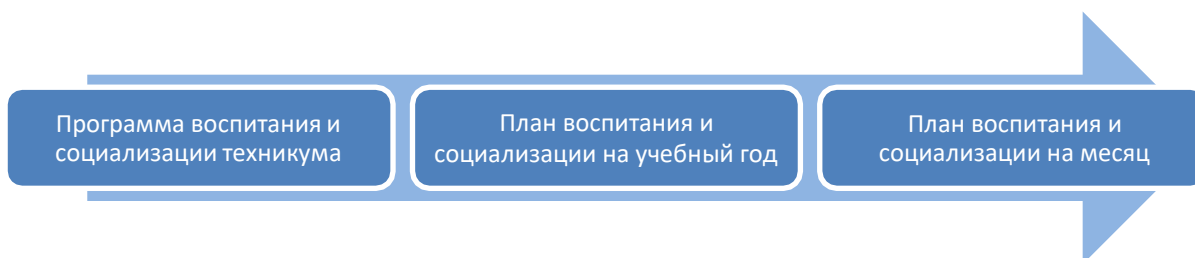
Схема реализации Программы